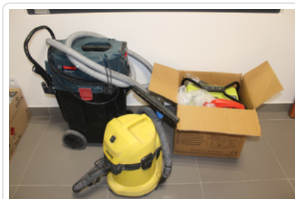
Rzeczy zabezpieczone przez policjantów

Policjanci z patrolu zostali skierowani do Raszyna, gdzie według zgłoszenia mężczyzna został ujęty na kradzieży.