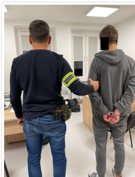
Policjant z zatrzymanym mężczyzną

Pod koniec września i w listopadzie policjanci z pruszkowskiej komendy byli informowani o podpaleniach głównie śmietników na terenie Pruszkowa. W związku z tymi zgłoszeniami policjanci prowadzili szeroko zakrojone czynności mające na celu ustalenie sprawcy tych podpałów.